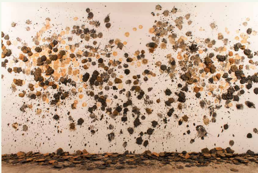
De malagana, 2015, boue.

Née en 1982 à Bogotà, 1982. Vit et travaille à Cali (Colombie). Diplômée de l'Institut Départemental des Beaux Arts de Cali, du Post-diplôme de l'ENSBA de Lyon et de Homework Space Program à Beyrouth. Son travail est basé sur des documents et des histoires banales, qu'elle utilise comme argument pour fabriquer des images absentes et faire parler les conflits contenus en elles. Elle travaille autour de l'idée du document performatif, expérimentant avec des matériaux traditionnels tels que l'argile et des médias immatériels tels que la performance, la vidéo, le texte.