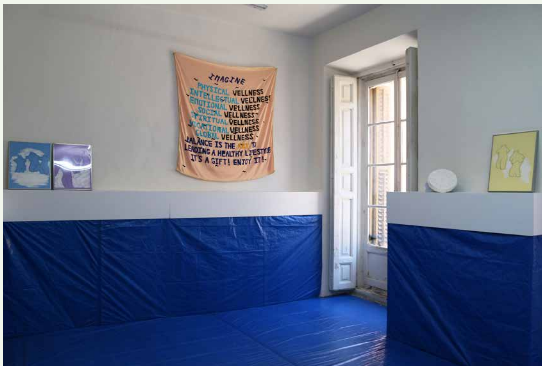
Vue de l'exposition The Splash room , 2016, Salón, Madrid.

Née en 1987. Vit et travaille à Paris. Diplômée des Beaux-arts d'Angers et de la HEAD de Genève. Dans son travail elle projette l'image de la vie comme une représentation théâtrale. Elle crée des micro-fictions qui pourraient s'apparenter à de courtes rêveries. Inspirée autant par la culture populaire que par l'anthropologie, le cinéma, l'histoire de l'art, elle développe des narrations inédites où le geste implique l'intégration complète du processus de création. Attachée à une esthétique self-made, elle développe un univers définitivement fun et pop où l'exagération, le superficiel et l'artificiel sont mis en avant. Elle s'amuse à jouer avec les codes et les symboles visuels.