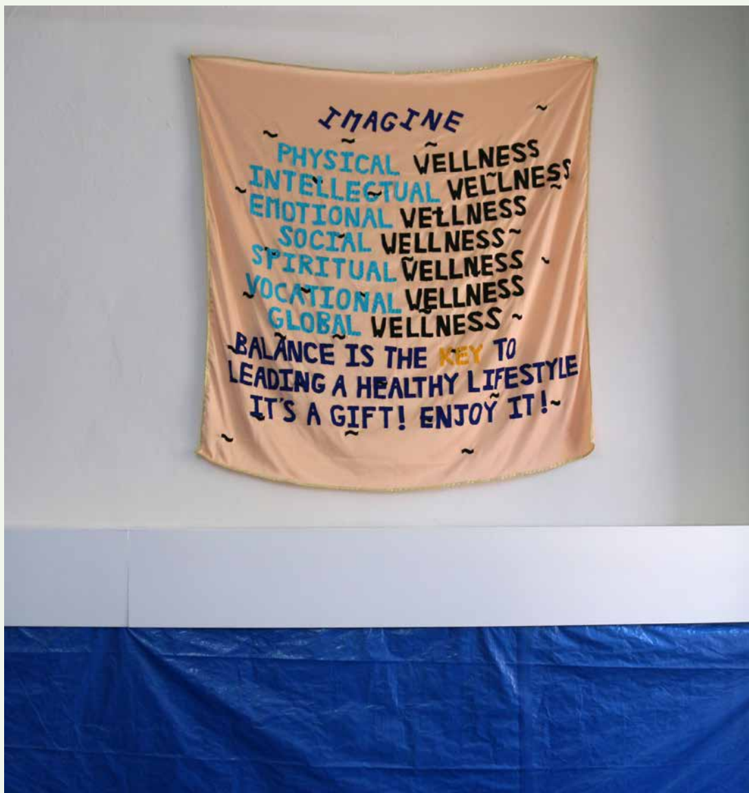
Vue de l'exposition The Splash room (détail), 2016. Bâche bleue, bannières en satin, Salón, Madrid.