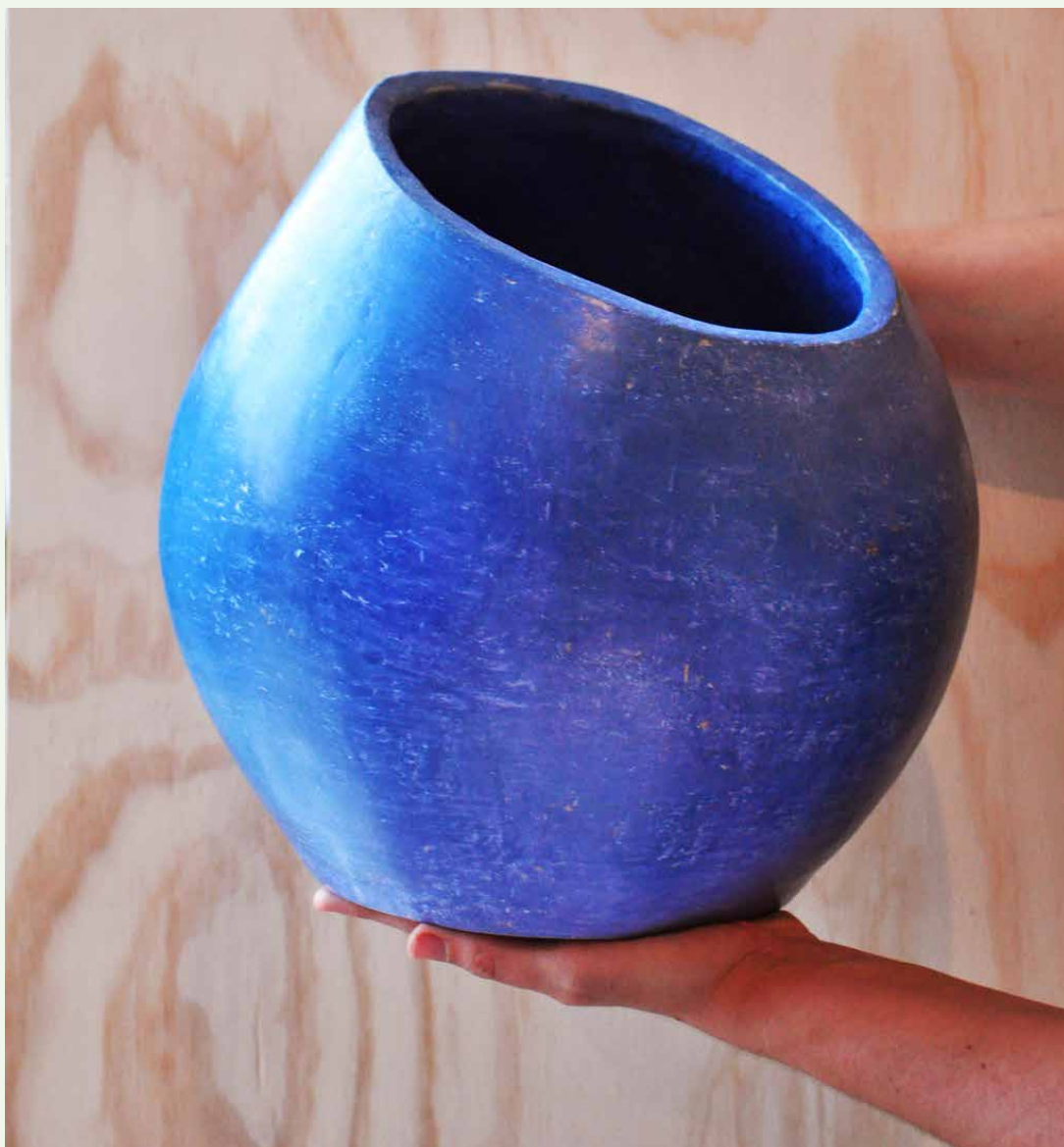
Flor o florero (détail), 2016. 12 vases en argile, son.