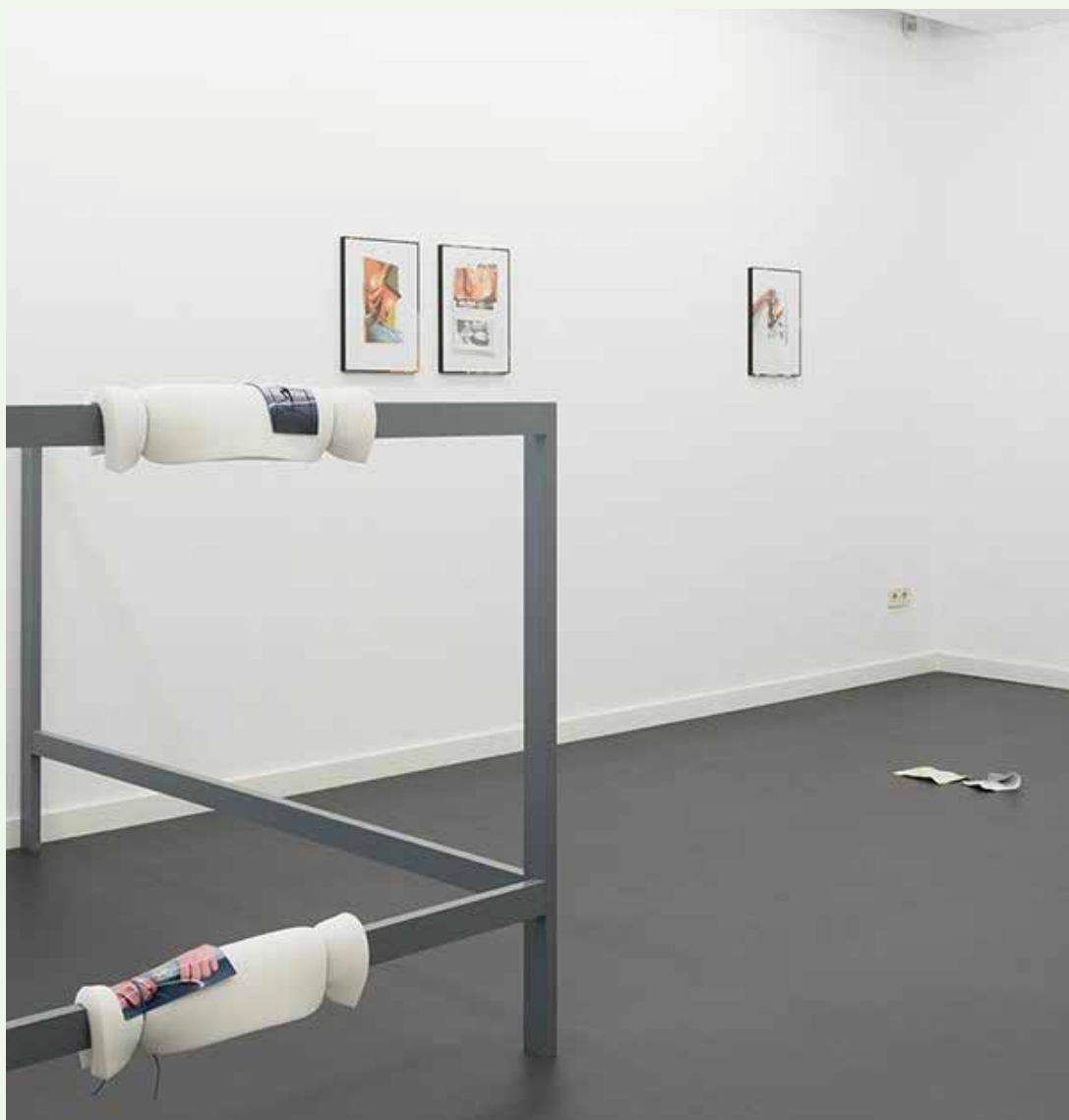
Vue de l'exposition Retrospectiva , Garcia Galeria, Madrid, 2016.