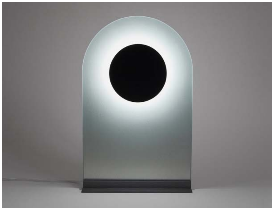
Eclipse 2015 lampe