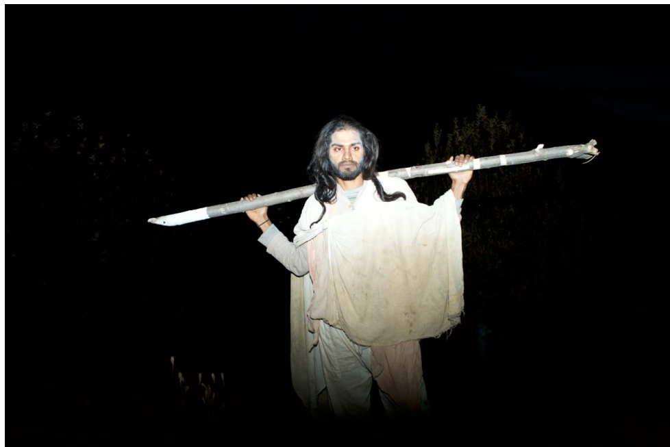
Psychomagie #2 tirage couleur arentique 76x114mm, 2016