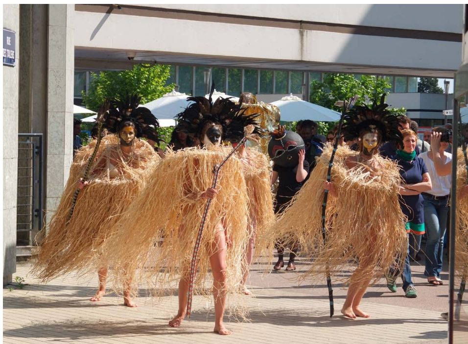
Vue de : Noa Performance/parade, Cergy, 2013