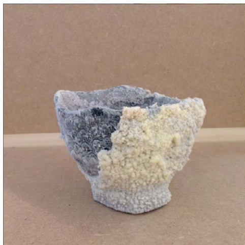
LAURA O'RORKE série Telomeris - 2015